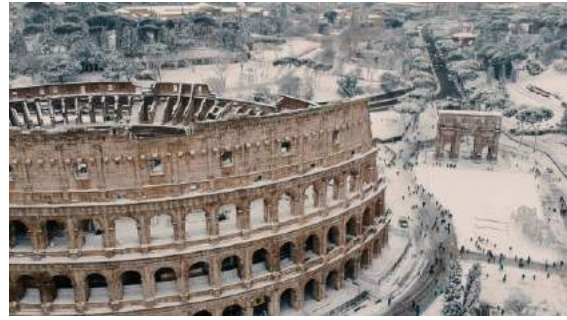
Snow in Rome is rare, photo: National Geographic

The minimum temperature in January is about 5°C and maximum 13°C- it's the coldest month of the year. I don't think I have to write about the temperature in the summer.