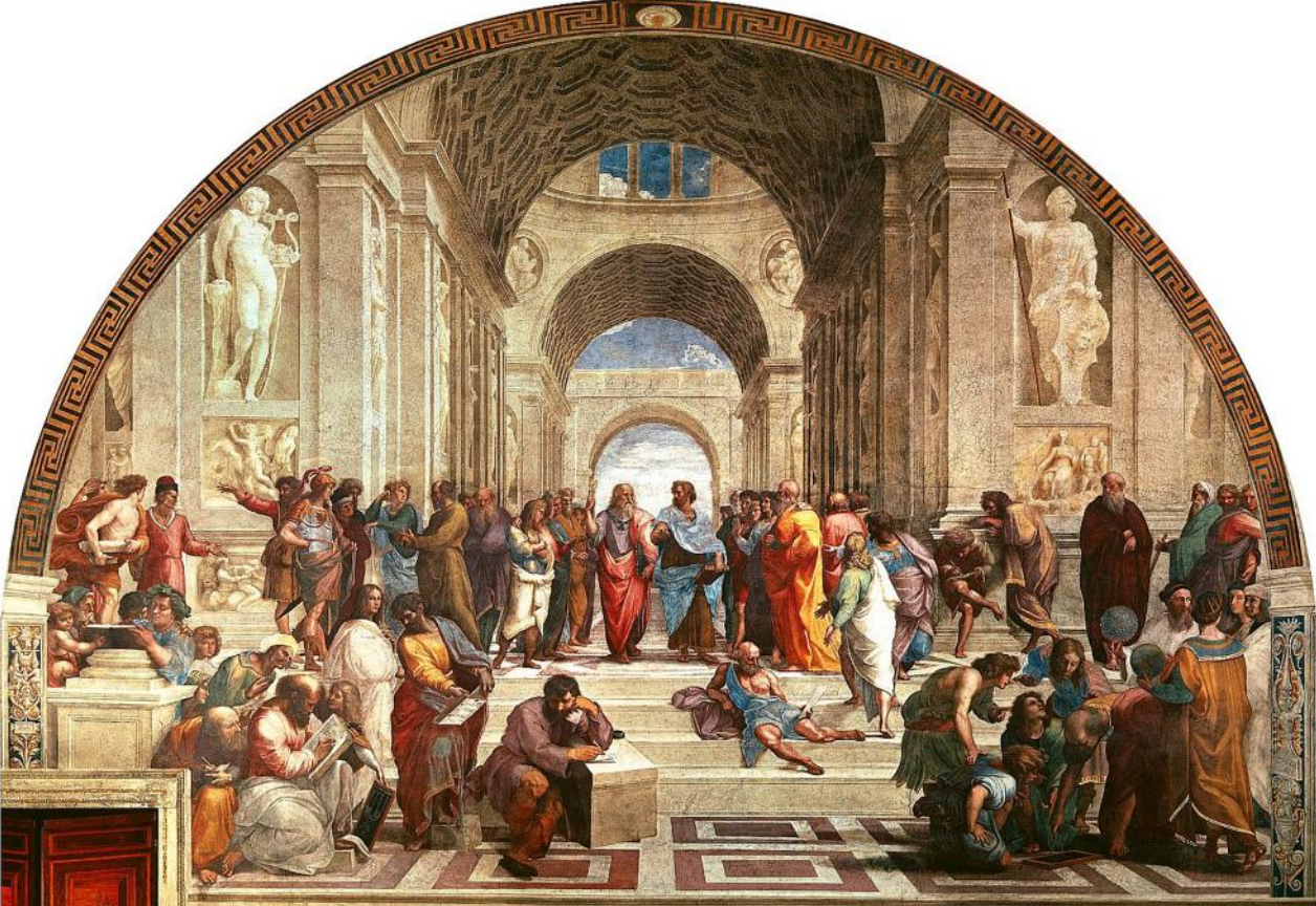
Szkoła Ateńska Rafael Santi